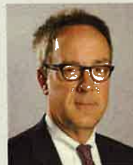
Fabian Roberg